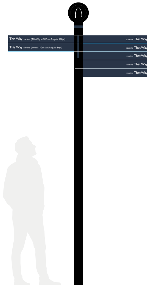
ST2a - Fingerpost Slat: 800mm (w) x 100mm (h) x 20mm (d)