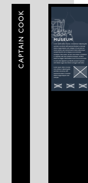
ST3 - Marker 350mm (w) x 1400mm (h) x 140mm (d)