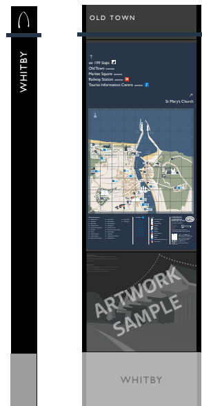
ST1 - Monolith 650mm (w) x 2200mm (h) x 140mm (d)